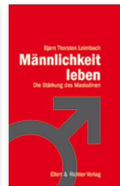
Männlichkeit leben von Bjørn Leimbach