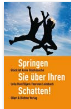
Springen Sie über Ihren Schatten von Leila Bust & Bjørn Leimbach